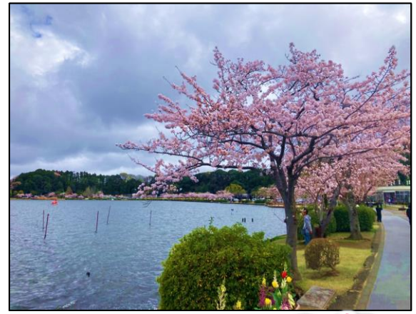
千波湖の桜の様子

○令和6年3月25日に開催した第19回桜川清流ルネッサンスⅡ地域協議会では、桜川・千波湖における水環境の現状や、「桜川水系クリーン作戦」等の水環境改善活動の取組が報告されたほか、令和5年度までとなっている行動計画の延長等について協議を行い、水質や流量に関する目標が未達成の地点があること等の課題を踏まえ、引続き桜川・千波湖の水環境改善に継続して取り組んでいく事としました。