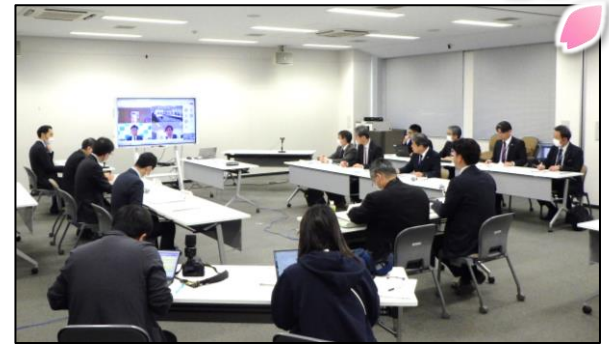
流域治水協議会の様子

○『久慈川・那珂川流域治水プロジェクト 2.0』では、気候変動の影響を踏まえた水害リスクを示すほか、新たな取組の追加や既存の取組の充実を図ることを掲げています。