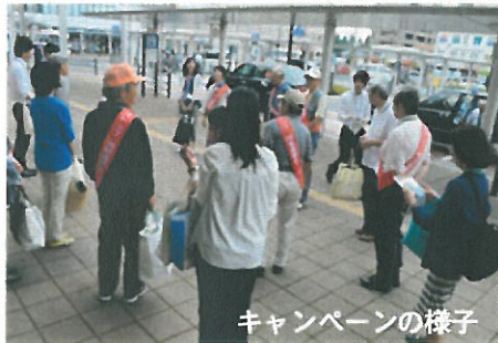
キャンペーンの様子

7月10日(金)朝7時15分から勝田駅・東西自由通路、東口、西口の周辺で、本会員と市の職員による夏の温暖化防止キャンペーンを行いました。