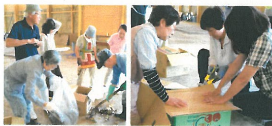
右は箱作り。左は基 材配合と生ごみ投入の様子。

今月、市民を対象に親子で参加できる生ごみ段ボールコンポスト講習会を開催します。(1面)