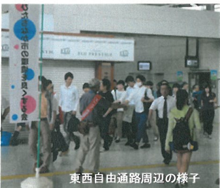
東西自由通路周辺の様子

今年は、地球温暖化防止のため「省エネ・節電」を呼びかけるチラシとともに、昨年の環境保全啓発ポスターコンクールの温暖化防止部門で、最優秀作品に選ばれた「ポスターの絵柄が入ったティッシュ」などを、啓発用グッズとして駅で乗り降りする多くの人に配りました。