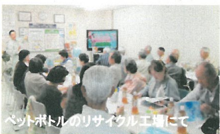
ペットボトルのリサイクル工場にて

指導員を主な参加者として視察研修を毎年行っており、今年は栃木県にあるペットボトルのリサイクル工場を視察し、画期的な進歩として、ペットボトルから飲料用のペットボトルが出来ることを知りました。道路の植樹の植栽、ゴミゼロ運動、不法投棄の見廻り等、継続的な活動をしています。