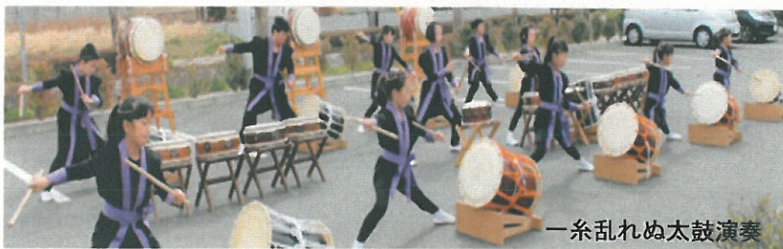
一条乱れぬ太鼓演奏

会員手製の竹ぼっくり、篠竹鉄砲、回転装置付き竹トンボに挑戦する子どもたちも多く、中でも空高く飛ぶ竹トンボに大きな歓声が上がりました。