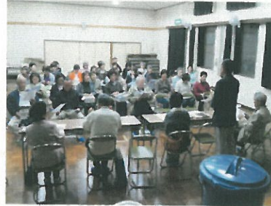
生ごみの出し方説明会

3年間に生ごみを提供下さった延べ185世帯の方、堆肥の効果試験を実施頂いた延べ11軒の農家の方、堆肥施用作物の食味試験に参加の方、ご協力有難うございました。このデータを基に次の段階に歩を進めて行きたいと思っています。