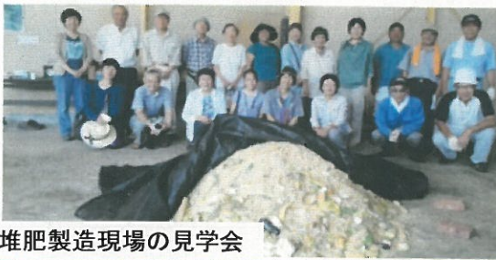
堆肥製造現場の見学会

6月から3か月間100世帯(東中根団地自治会と柳が丘自治会各50世帯)の方に週2回生ごみ提供依頼。6か月後、堆肥約3.6トン完成。3軒の農家に堆肥の効果試験依頼。