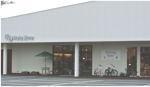
Home Sic Style shop ひたちなか店 住所 東石川2-16-2 Tel 219-7180 営業時間 10:30~19:00 水曜日定休