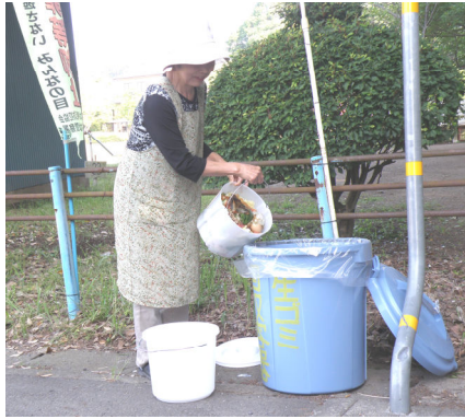
大形バケツに生ごみを入れる協力者

環境四季時計、竹林と多良崎城跡環境整備を継続するとともに、名平河浄化実験も引き続き実践し、地球温暖化防止講座の開催や、環境保全啓発活動も推進いたします。(若林)