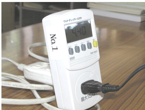
貸出しているワットチェッカー

電力消費量が激しくなる夏を迎えより一層の節電が求められています。もうこれ以上の節電など無理と諦めている方、ワットチェッカーをご存知ですか?