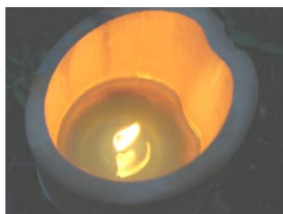
竹で作ったキャンドル

ヒップホップダンス、ギター演奏、環境漫才などにキャンドルの灯りが演出に加わり穏やかな雰囲気会場が包まれました。