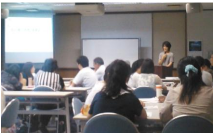
「環境教育研修会」での環境講座