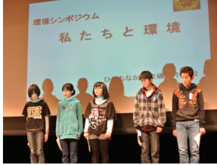
昨年度の活動発表の様子

シンポジウムは、枝川小学校『ひ るさと「枝川」をみつめよう』、田 彦小学校『みんなでつくる美しいまち 田彦』、阿字ヶ浦中学校『地域に残る 貴重な自然の保護活動(12年次)』、 (有)マキプランニング(仮)エ工 に関する取組「植栽の普及推進」 など、日頃から取り組んでいる活動 の発表を行います。