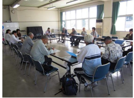
ディスカッションの様子

第2回環境ディスカッションを9月28日(土)に中央公民館で行いました。会長から「多くの会員の意見を頂き、有意義な会にしたい」との挨拶の後、今回のテーマ『本会として、地球温暖化防止のため何ができるか』について話し合いを行いました。