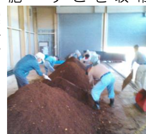
熟成中の生ごみ堆肥