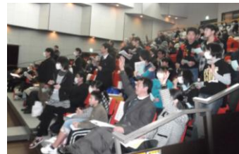
昨年度のエコアトラクション