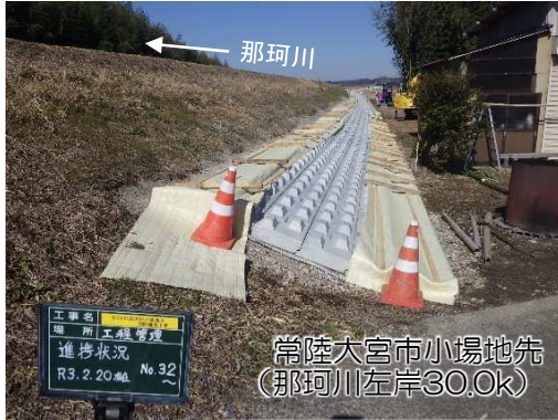
常陸大宮市小場地先 (那珂川左岸30.0k)

○洪水によって河川の水位が堤防を越えて越水しても、決壊までの時間を少しでも引き延ばすよう、堤防構造を工夫する対策として、コンクリートブロックによる宅地側の堤防法尻の補強や堤防天端の舗装を実施しています。