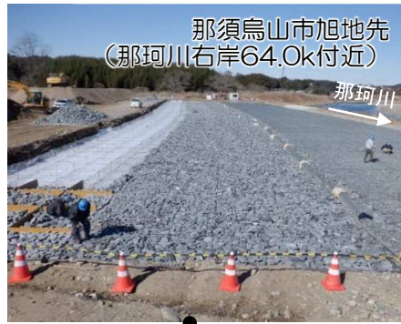
那須烏山市旭地先 (那珂川右岸64.0k付近)