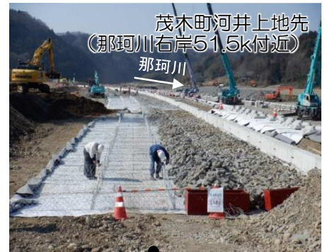
茂木町河井上地先 (那珂川右岸51.5k付近)