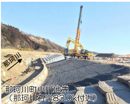
那珂川町小川地先 (那珂川右岸83.0k付近)

○令和元年東日本台風による出水で壊れた護岸や削れた河岸の復旧をしています。河川内では出水期中（6月～10月）に工事が出来ないため、令和2年の5月までに 応急的に補修等を行い必要な機能を確保 し、11月から 本格的な復旧工事を開始 しました。 現在、那珂川の28箇所で行っています。