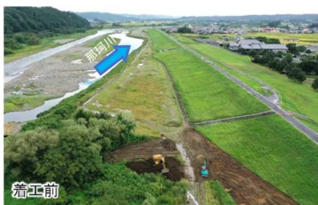
那珂川町小川地先 那珂川右岸83.0k付近

○台風第19号による出水で傷んだ護岸や崩れた河岸の復旧を行っていた災害復旧工事について、完了した箇所をいくつかご紹介します。