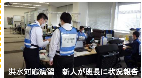
洪水対応演習 新人が班長に状況報告