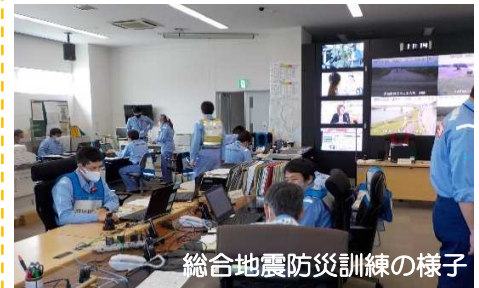
総合地震防災訓練の様子