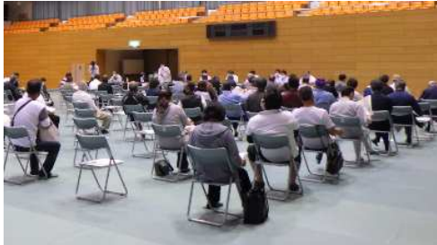
大場遊水地説明会