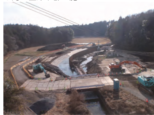
12月：右岸下部工施工と河川切替