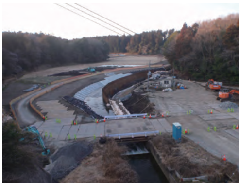
2月：右岸排水工と護岸施工