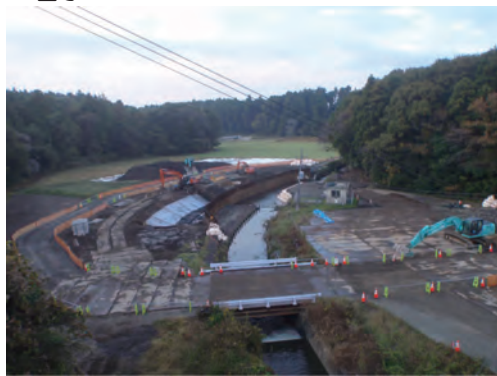
10月：左岸河川締切りと護岸施工