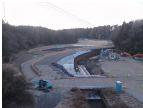
1月：右岸の河川締切りと護岸施工