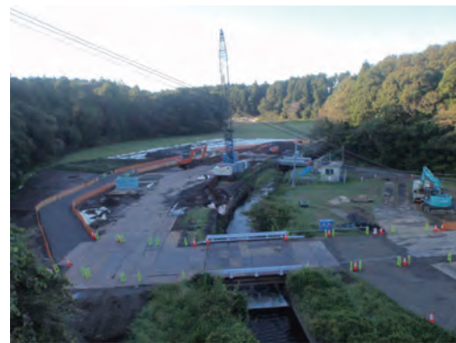
9月：左岸下部工施工