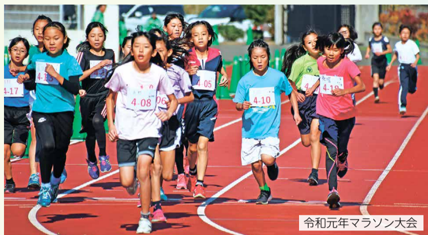
令和元年マラソン大会

市内各20小学区の子ども会および子ども会育成会では、次世代を担う子どもたちの健全育成を図ることを目的に、相撲大会などさまざまな事業を実施しています。