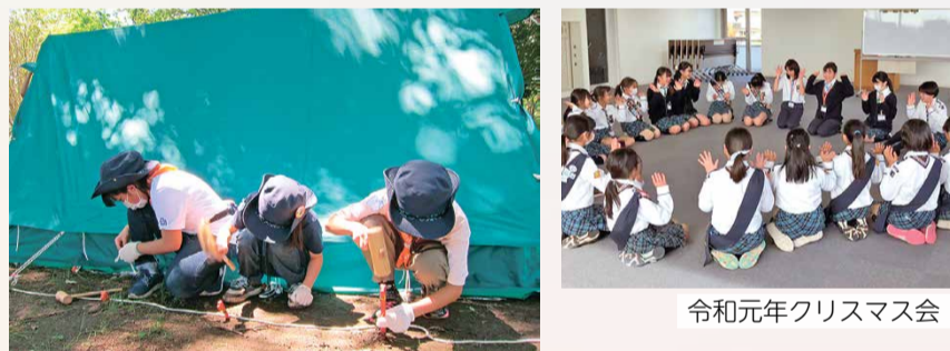
令和元年クリスマス会

ガールスカウトは、イギリスで発祥し、現在世界150の国や地域で活動する、少女と女性のための社会教育団体です。日本のガールスカウト運動は、2020年に100周年を迎えました。女性の幸せを願う年代に応じたさまざまな体験プログラムを提供し、「自ら考え行動できる女性」を育てています。ガールスカウトで「いろいろなことができる自分」を見つけてみませんか。