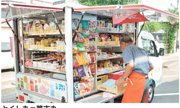
とくし丸=篤志丸 由来は、公共の福祉などに熱心に協力する「あつい志」

買物困難者支援事業として、(株)セイブが家の前で見て・買って・注文できる移動スーパー「とくし丸」を運行しています。そして新たに、7月9日から(株)セイミヤでも「とくし丸」の運行が始まります。 「近くにスーパーがない」、「バスや電車などの移動手段がない」、「免許返納を考えているが、車でスーパーに行けなくなるのが心配」、そんな声にお応えします。詳しくは、問い合わせください。 ※市と協定を締結し、高齢者の見守り活動も行います。