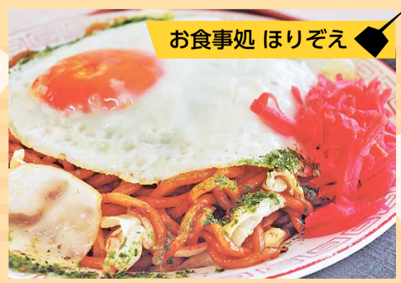
お食事処 ほりぞえ

目玉焼きがもちもちの麺に絡み、まろやかで優しいおふくろの味に。ボリューム満点の焼きそばです。 平磯町 1594-1 ☎ 263-6282 11:00～15:00 定休日不定休 テイクアウト有