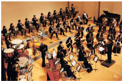
ひたちなか市文化会館

そんな私のオススメスポット は、コンクールや定期演奏会の会 場としても馴染み深い、ひたちな か市文化会館。音の響きが心地良 く、練習場としてもオススメ。私 の青春時代の思い出が詰まった大 切な場所です。