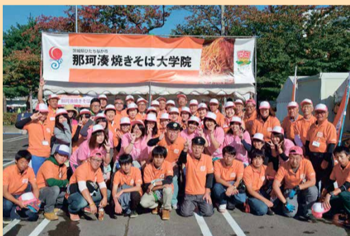
▲B-1グランプリ in 十和田大会参加の様子