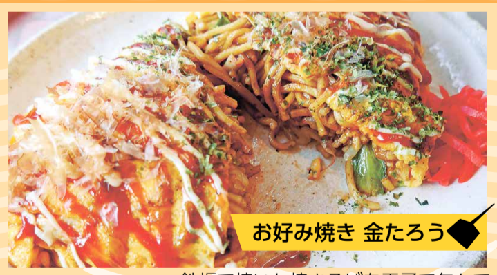
お好み焼き 金たろう

50年続くお店自慢の一品。味はソースとしょう油の2種類から選べます。ラードと豚骨スープが味の決め手。 湊中央町 1-5-12 ☎ 262-3551 11:00～20:00 定休日不定休 テイクアウト有