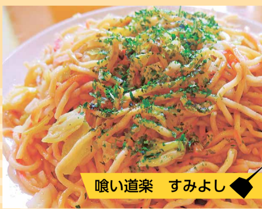
喰い道楽 すみよし

50年続くお店自慢の一品。味はソースとしょう油の2種類から選べます。ラードと豚骨スープが味の決め手。 湊中央町 1-5-12 ☎ 262-3551 11:00～20:00 定休日不定休 テイクアウト有