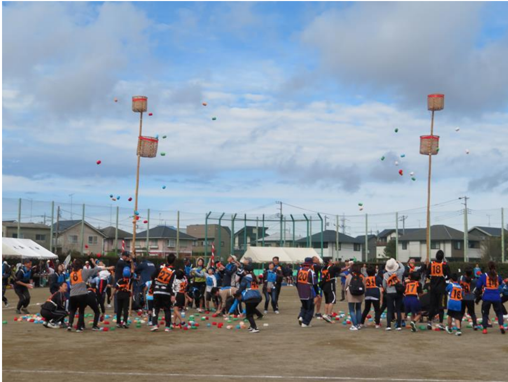
(写真) 令和元年度秋季運動会