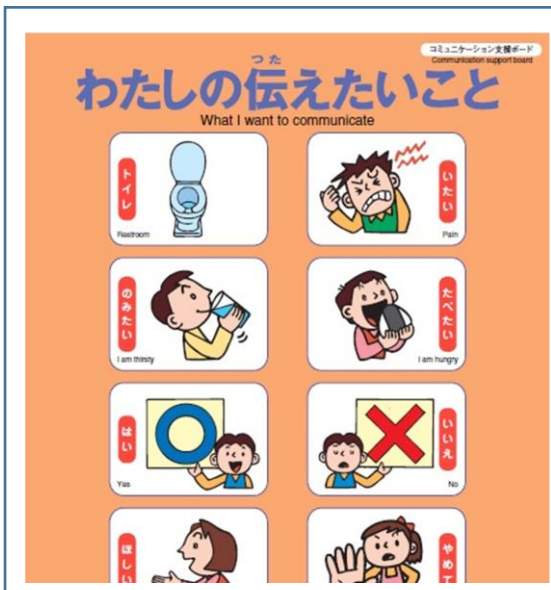
コミュニケーションボード