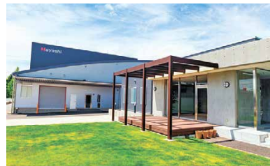
▲2018年9月にリニューアル

いわゆる「ポリ袋」など、ポリエチレン製の柔らかい包装材料を製造・販売する林産業。砂糖、塩、米など食品関係の袋から、点滴バッグや注射針の保護パッケージといった医薬品の包装材料、農業用の黒いロールシートまで、約1万種類に上る幅広い分野の包装材料を手掛けています。中でも、砂糖の袋は国内シェア約3割を誇り、全国のスーパーで見ることが出来ます。