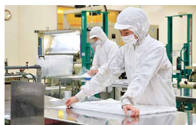
▲衛生的なクリーンルームの工場