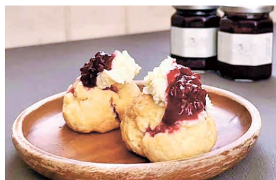
▲焼きたてスコーンとコンフィチュール

気になるスポットは「ラ・テーブル・ドゥ・イズミ」。友人のインスタを見て知ったのですが、スコーンや紅茶がとてもおいしいそうなので、紅茶好きの自分としてはぜひ行ってみたいお店です。