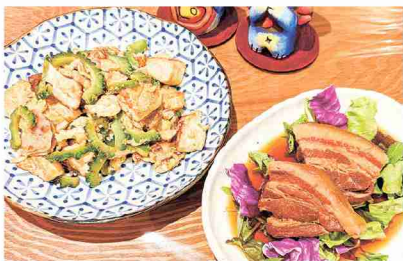
▲ゴーヤチャンプルーとラフテー

市のおすすめスポットは「かりゆし」という沖縄料理屋さんで、飲み会に行ったのをきっかけに何度も足を運んでいます。このゴーヤチャンプルーとラフテーが絶品なのでぜひ！