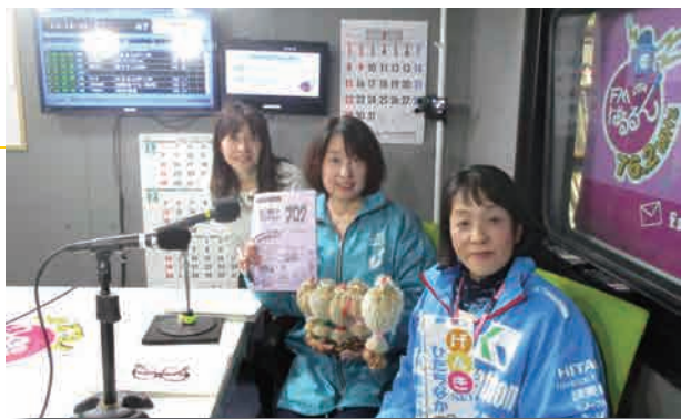
▲ 「げんき-NETひたちなか事務局」も出演しました。