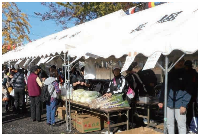
▲一中地区コミュニティまつり

コミュニティまつりは、全てのコミュニティセンターで開かれています。今年度は、10月末から12月初旬にかけて行われました。各日、天候にも恵まれたため、多くの方が集まり、焼きそばなど食べ物の模擬店では、お昼前に完売するほどでした。また、金魚すくいなど子どもが楽しめるコーナーも多く、幅広い世代の方がふれあう機会となりました。