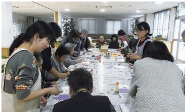
▲ 高齢者福祉施設で折り紙を教える受講者

「げんき-NETひたちなか事務局」(市民活動課内)では、毎年市民活動に役立つ講座を開いています。今年度は、折り紙やアートセラピーなどのボランティアに活かせる内容を学び、高齢者福祉施設等で実際にボランティア体験をしました。参加者は、施設利用者とのふれあいを通して、今後の活動のきっかけをつかむことができました。