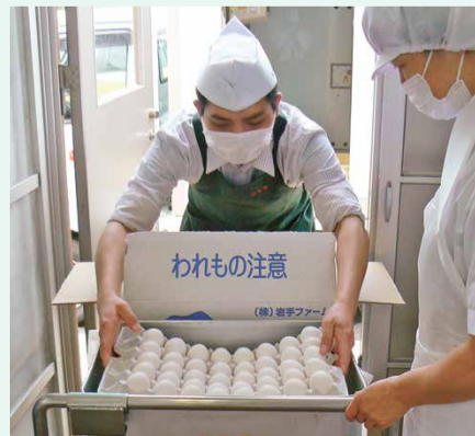
▲割れなどの不良品がないか一つ一つチェックします。