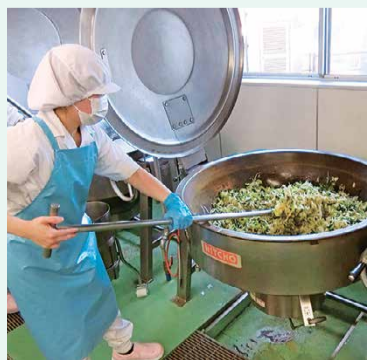
▲大きな釜を使って、炒める・煮る・あえるなどの調理をします。