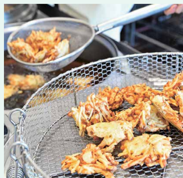
▲きれいなキツネ色に揚がりました。