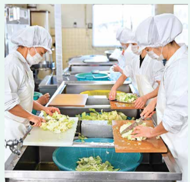
▲給食作りはスピードも求められます。