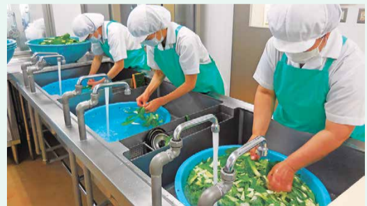
▲薬物は一枚一枚丁寧に洗浄。

野菜の皮むきや流水での洗浄など、丁寧に下処理を行います。機械で処理できない部分は、調理員の手作業。一つ一つの工程に、愛情がいっぱいこもっています。