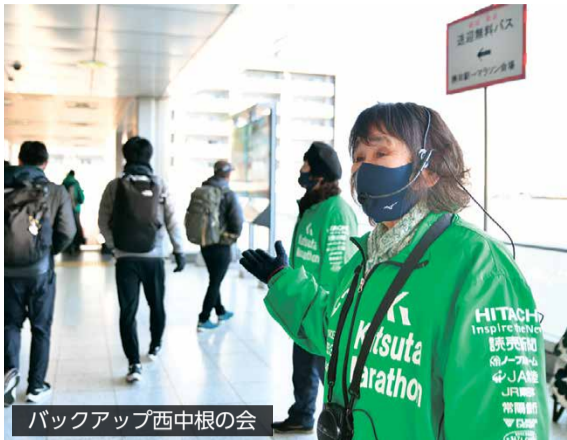
バックアップ西中根の会