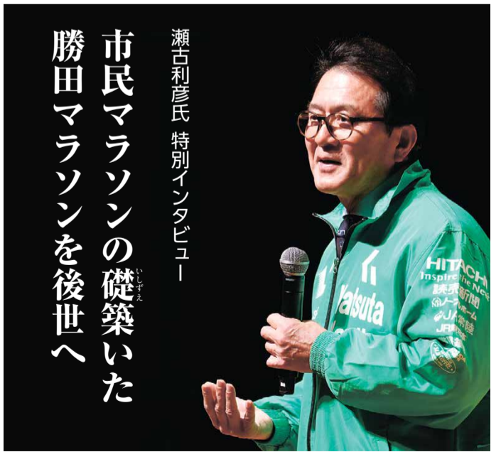
瀬古利彦氏 特別インタビュー

「また来年もいらしてください」 「また来年もいらしてください」 「また来年もいらしてください」