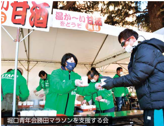
堀口青年会勝田マラソンを支援する会