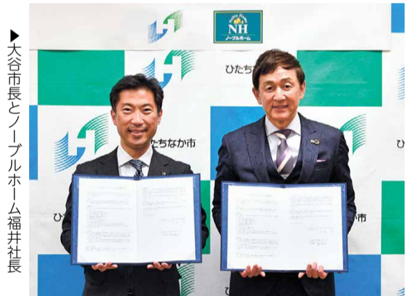
▶大谷市長とノーブルホーム福井社長

協定の締結により、本市の暮らしやすい生活環境等の魅力発信をはじめ、地域振興、安全・安心な暮らしなど、幅広い分野にわたっての連携が可能となります。