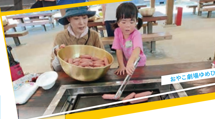
おやこ劇場ゆめひろばのキャンプ体験