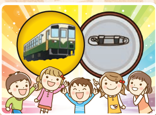
缶バッジ作成体験