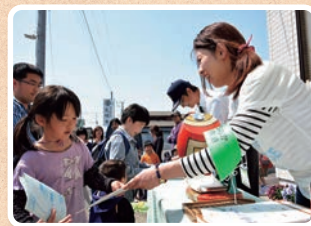
スタンプラリー抽選会