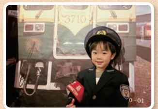
こども制服撮影会