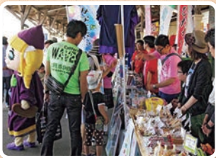
地元名産品の販売・ふるまい