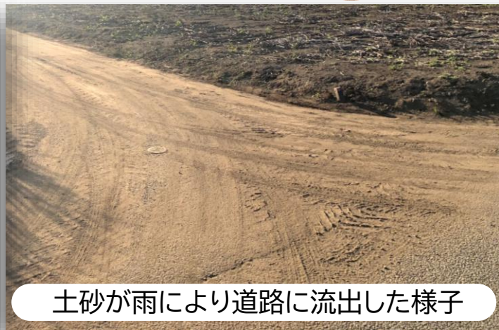
土砂が雨により道路に流出した様子

農地所有者や耕作者の皆様には、こうした問題を引き起こさないように、土砂等の流出防止対策を実施していただきますよう、ご理解・ご協力をお願いします。