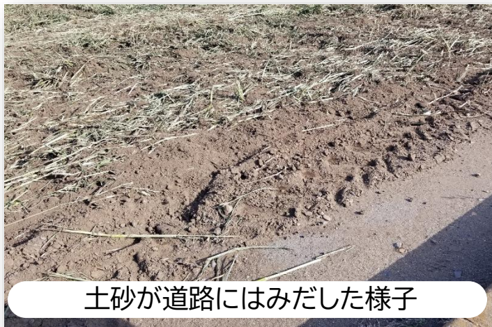
土砂が道路にはみだした様子