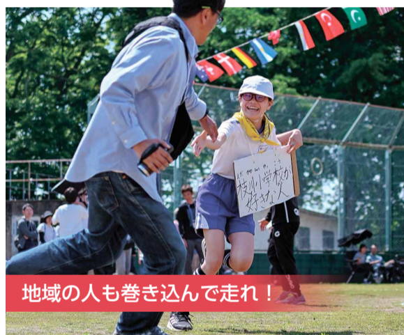
地域の人も巻き込んで走れ！