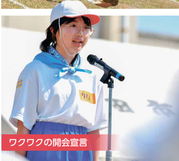
ワクワクの開会宣言