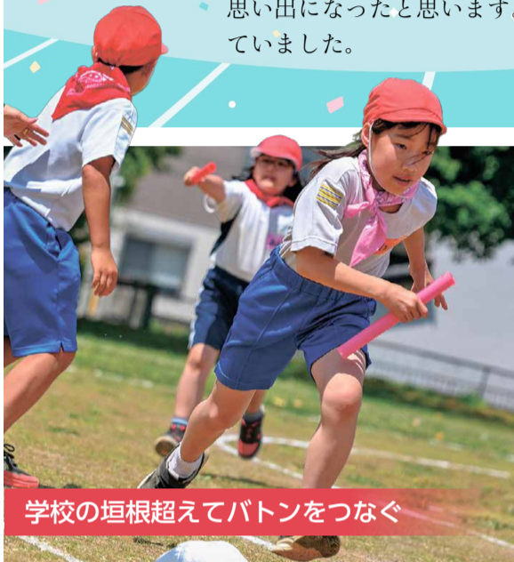
学校の垣根を超えてバトンをつなぐ