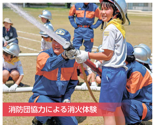
消防団協力による消火体験