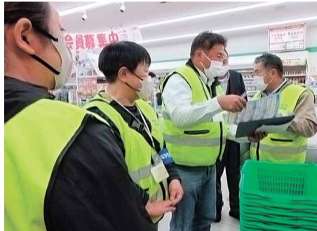
このステッカーが目印！

定期的に小・中・高校などを訪問し、各学校との情報連携のための協議をしています。店舗訪問は、青少年と関わりが深い店舗に対して、「青少年の健全育成等に関する条例」などについて周知・啓発を行うとともに、「青少年の健全育成に協力する店」の登録活動を促しています。