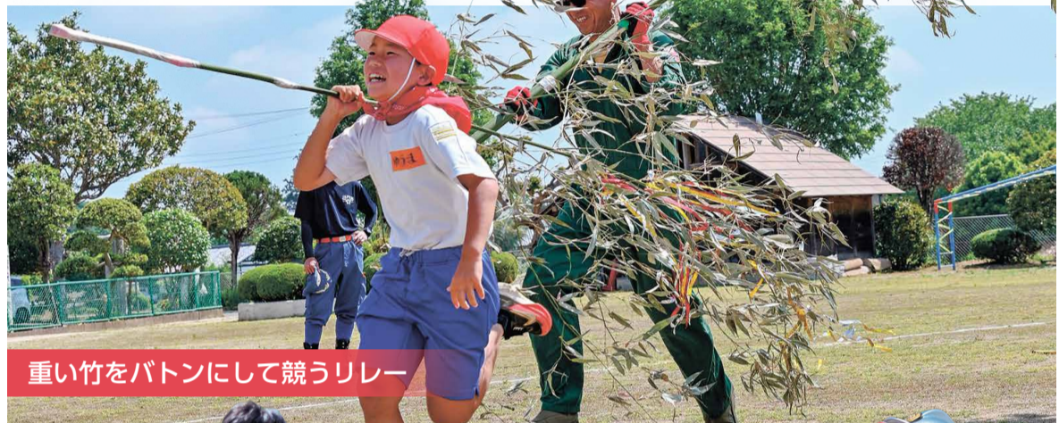
重い竹をバトンにして競うリレー