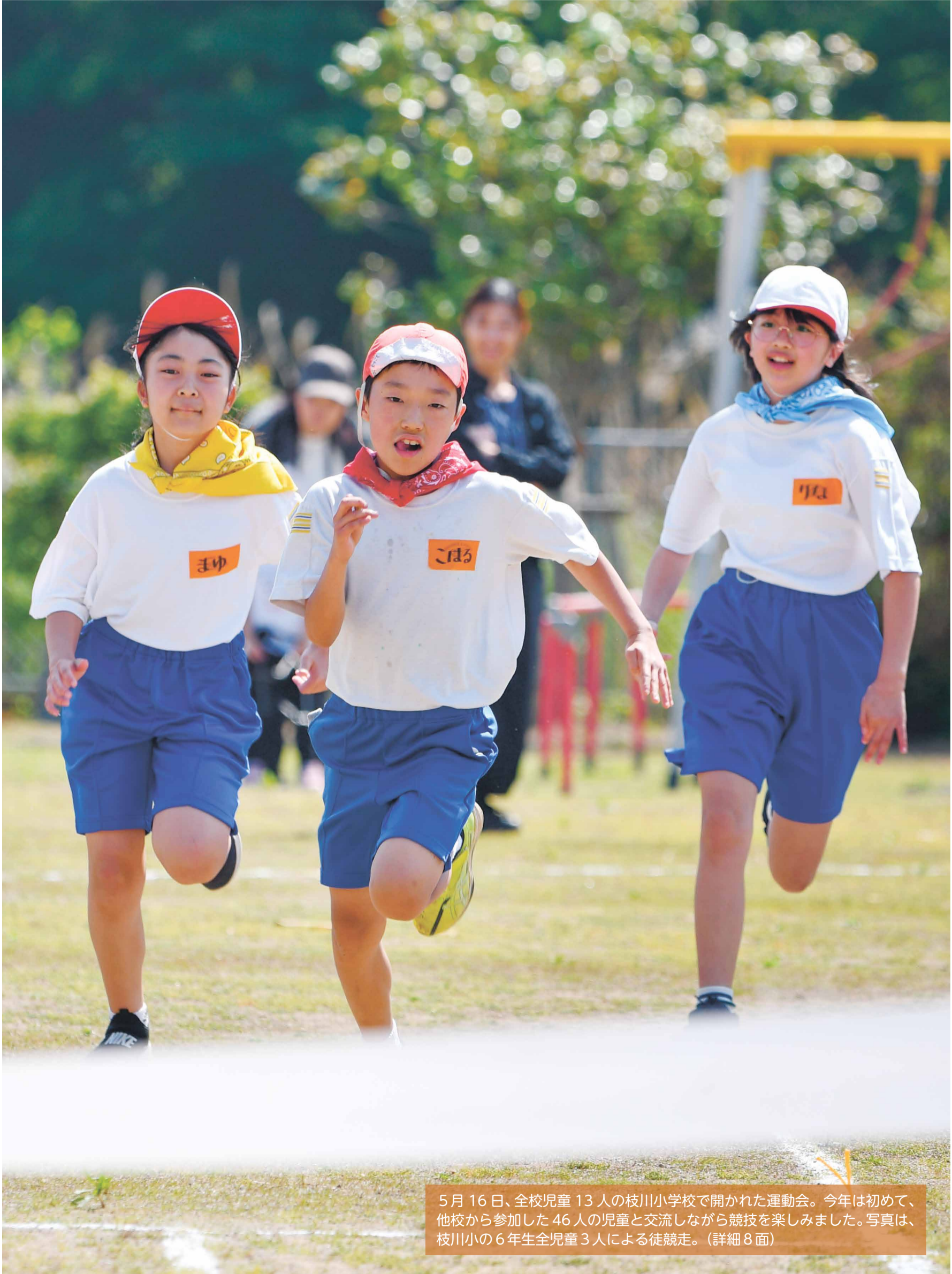
5月16日、全校児童13人の枝川小学校で開かれた運動会。今年は初めて、他校から参加した46人の児童と交流しながら競技を楽しみました。写真は、枝川小の6年生全児童3人による徒競走。(詳細8面)

発行 ひたちなか市広報戦略課 ☎029(273)0111 編集 〒312-8501 ひたちなか市東石川2丁目10番1号