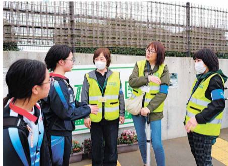
青少年相談員はこの「腕章」と「ベスト」を着用しています。

班単位で中学校区の駅や公園、学校などを巡回し、「声かけ」や「見守り」を中心に地域に根ざした活動に努めています。お祭りやイベントなどにも見回りを実施しています。活動時は、腕章とベストを着用していますので、見かけた際には気軽にお声かけください。