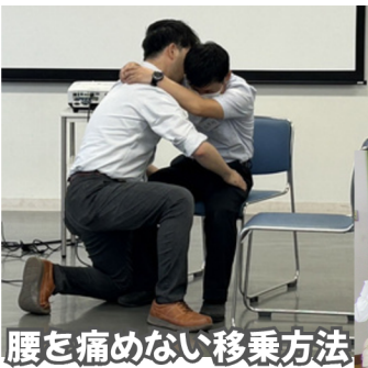
腰を痛めない移乗方法