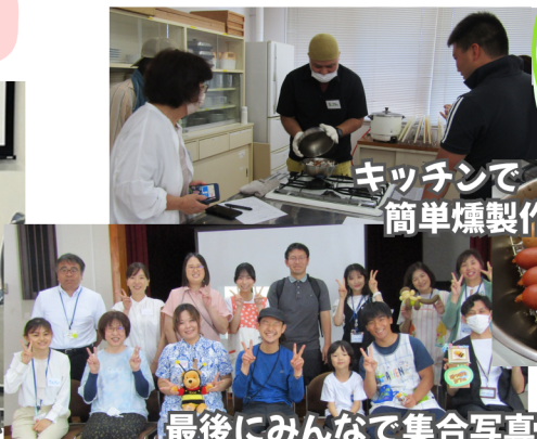
キッチンで 簡単揚げ作り