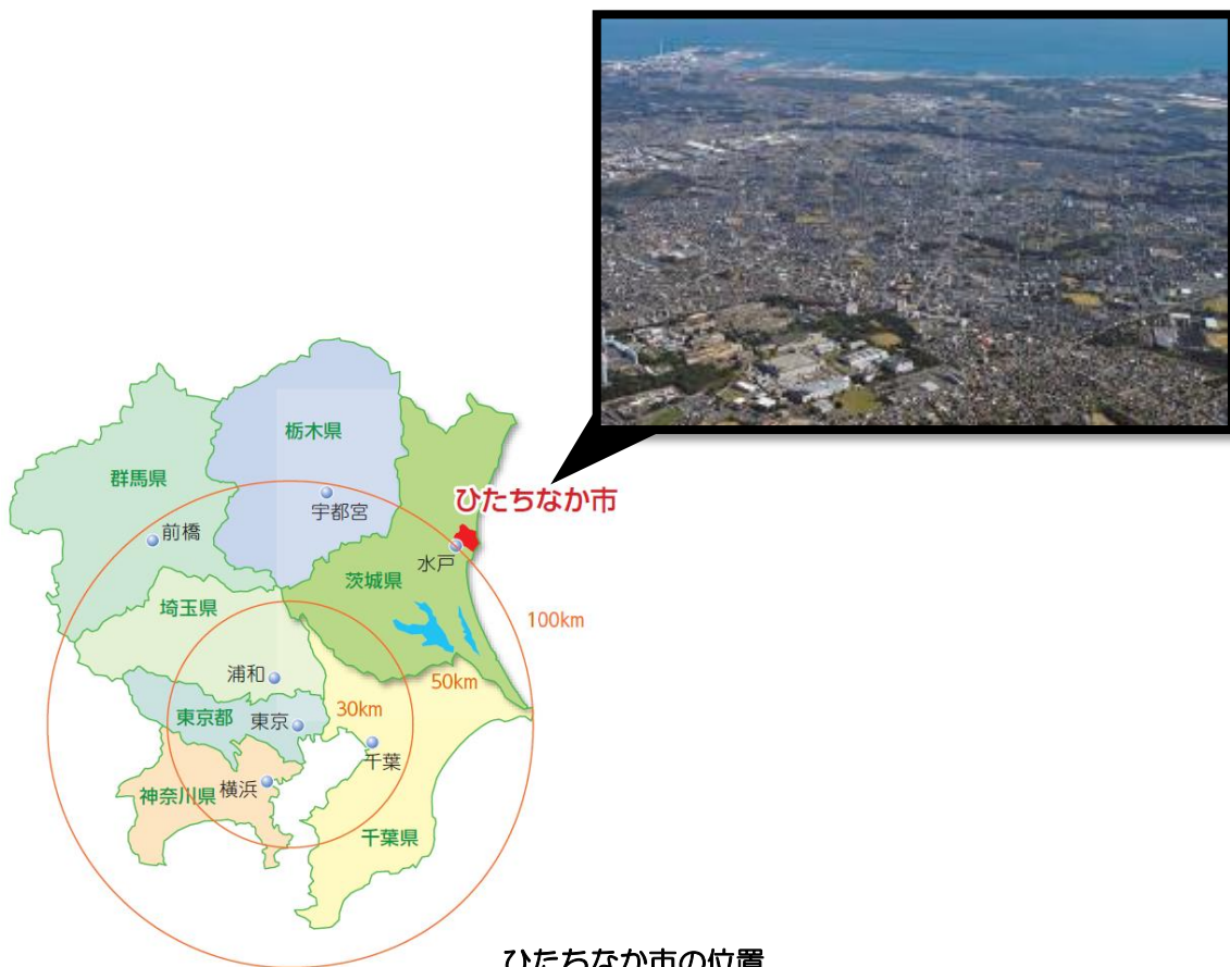
ひたちなか市の位置

本市は、東京から約 110km の距離にあり、茨城県の中央部からやや北東に位置し、東西約 13km、南北約 11km で 99.96km 2 の面積を有しています。西は常磐自動車道の通る那珂市に、北は東海村に、南は那須岳を源流とする那珂川を挟んで県都水戸市と大洗町に接し、東は美しい碧の海の広がる太平洋に面して約 13km の海岸線が続いています。市域は、太平洋と那珂川下流域に位置する海拔 7m 前後の低地地区と阿武隈山系から南東に緩やかに傾斜している那珂台地と呼ばれる海拔 30m 前後の起伏の少ない平坦な台地地区とに分けられています。低地地区は、漁港を中心に市街地が形成され、那珂川流域には水田地帯となっています。一方、台地地区は、駅を中心に市街地が形成され都市化が進行していますが、周辺は畑地も多く、また、中小河川が市街地にくさび状に入り込み、台地縁辺部は豊かな緑が帯状に連なっています。