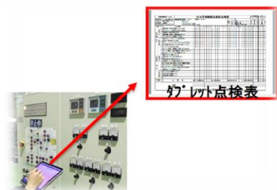
設備点検の電子化