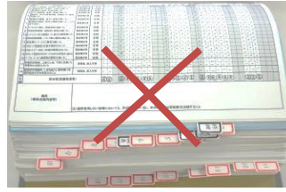
設備点検のペーパーレス化