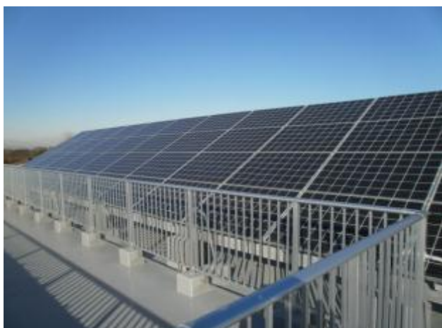
【屋上の太陽光パネル】

屋上に太陽光パネルが設置されており、日々の発電の様子が昇降口のモニターに映し出されています。発電を身近に感じることで節電への意識が高まっています。