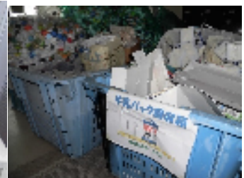
環境委員会 ・牛乳パックを回収し、 図書カードと交換。 【モウモウ文庫】