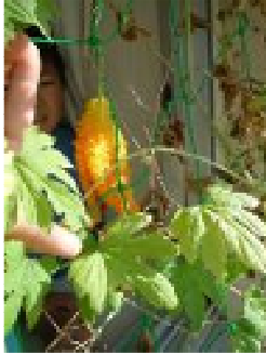
理科(4年ツルレイシの栽培)