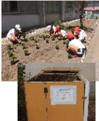
栽培委員会 ・花壇・プランター作り