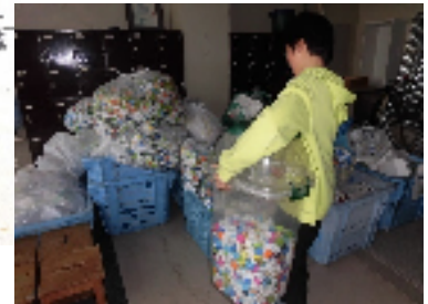
福祉委員会 ・エコキャップの回収