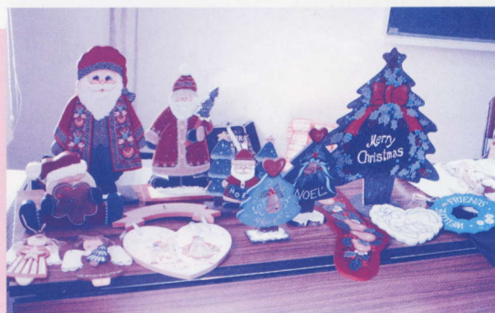
クリスマスを華やかに彩る作品の数々

あなたの筆は自由自在、動くまま、感じるままに自分で色を作り、あなただけのオリジナル作品を作りましょう。